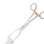
A3218 18.5cm サージカル スプリング クリップ アプリーケーター