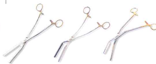
A3312 31.0cm ストレート