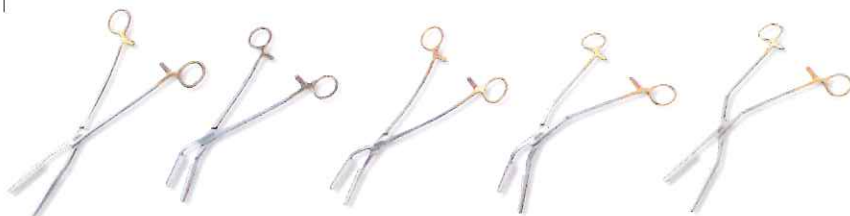
A3307 29.5cm ストレート