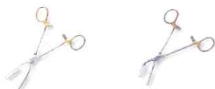
A3301 17.0cm ストレート