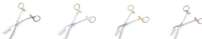
A3303 18.0cm ストレート